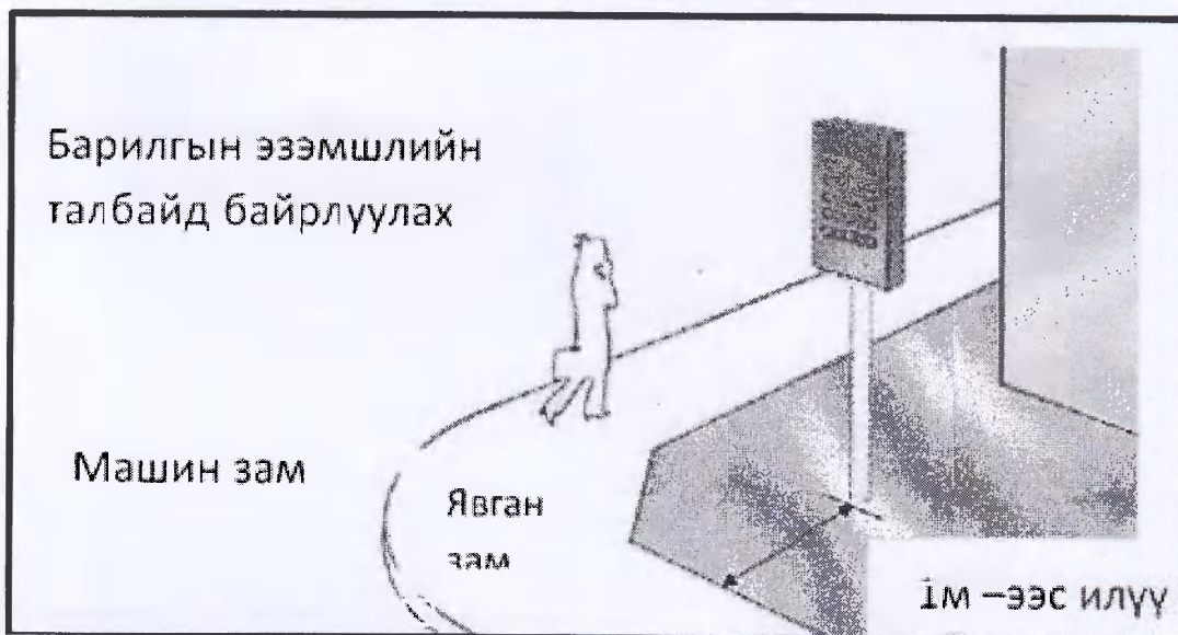
ЗУРАГ № 01