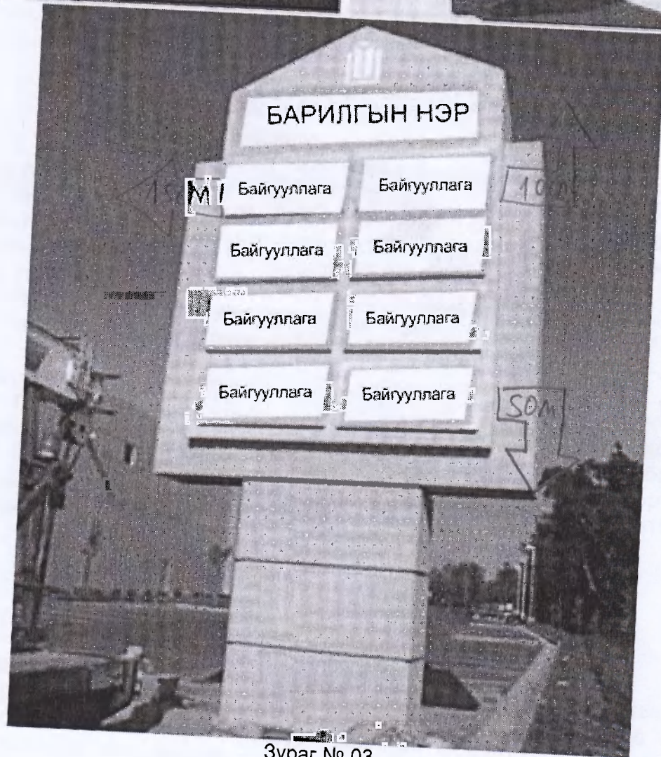
Зураг № 03